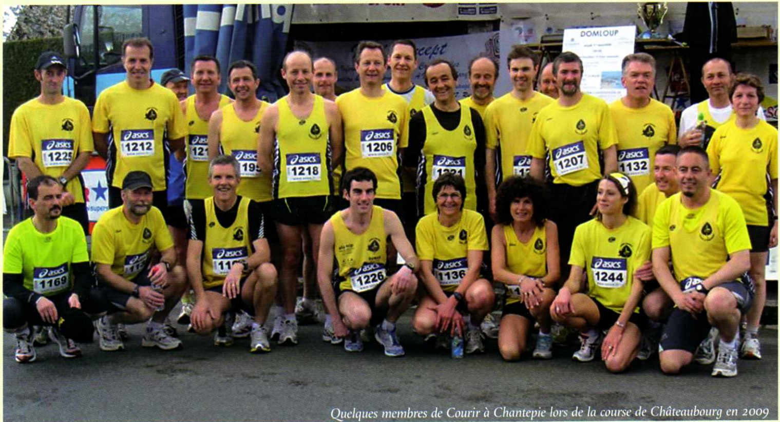
Quelques membres de Courir à Chantepie lors de la course de Châteaubourg en 2009

L'association Courir à Chantepie compte environ 200 membres qui se retrouvent lors de 3 entraînements hebdomadaires (mercredi, samedi, dimanche). Pour cette 11 ème édition, les organisateurs soutiennent l'association des fibromyalgiques de Bretagne.